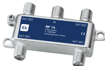
RF 13 / RF 14