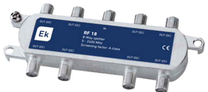
RF 16 / RF 18